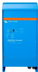
MultiPlus Compact 12/2000/80

Si des systèmes disposant d'un tableau de commande Color Control sont connectés par Ethernet, il est possible d'y accéder et de modifier leur configuration.