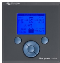
Tableau de commande Blue Power

Une solution pratique et bon marché pour une surveillance à distance, avec un bouton rotatif pour configurer les niveaux de Power Control et Power Assist.