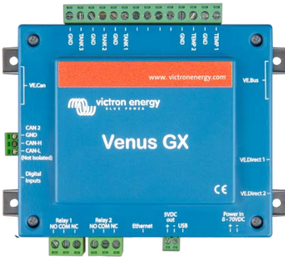
Venus GX avec connecteurs