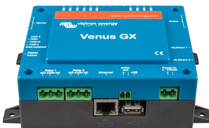
Venus GX – vue de face