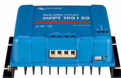
Contrôleur de charge solaire MPPT 100/50