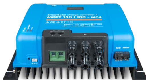
Contrôleur de charge solaire MPPT 150/100 MC4 sans écran