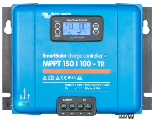
Contrôleur de charge solaire MPPT 150/100-Tr avec un écran enfichable

Elle compense les tensions de charge Float et d'absorption en fonction de la température.